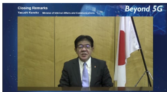
日本总务省大臣 金子恭之先生致闭幕词

会议结束时，日本总务省大臣金子恭之先生致闭幕词。他传达了一个强烈的信号，即日本将通过本次会议进一步加快国际交流与合作，引领国际讨论，以实现后5G时代。