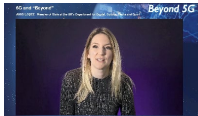
英国数字、文化、媒体和体育部国务大臣 朱莉娅·洛佩斯女士发言

欧洲和美国的电信公司（包括诺基亚和高通）解释了5G和后5G的前景，以及应用案例和实施这些案例的要求和技术。这些解释包括公司在其中发挥核心作用的后5G推进项目。