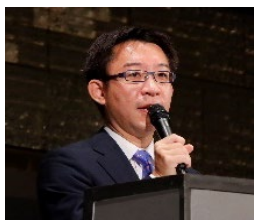
日本总务省大臣仲西祐介先生致开幕词

大会伊始，三位代表分别代表主办方日本总务省和后5G推进联盟致开幕词。这些代表是中西祐介先生（日本总务省大臣）、五神真先生（后5G推进联盟会长）和十仓雅和先生（后5G推进联盟副会长）。为了实现后5G时代，他们发出了一个强烈的信号，那就是，他们将动员产业界、学术界和政府的力量，加快国际合作，并以有形的形式提供具体的便利和消费者价值。