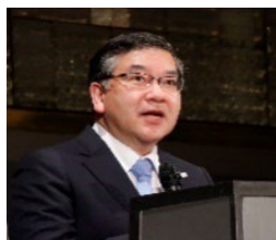
后5G推进联盟会长五神真先生致开幕词

总务省(MIC) 全球战略局 全球战略课 日本国东京千代田区 2-1-2霞关 邮编: 100-8926 电话: +81-3-5253-5920 传真: +81-3-5253-5924